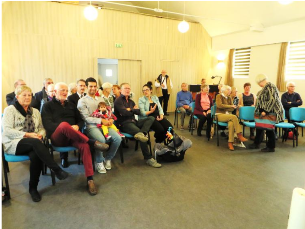
De eerste dienst