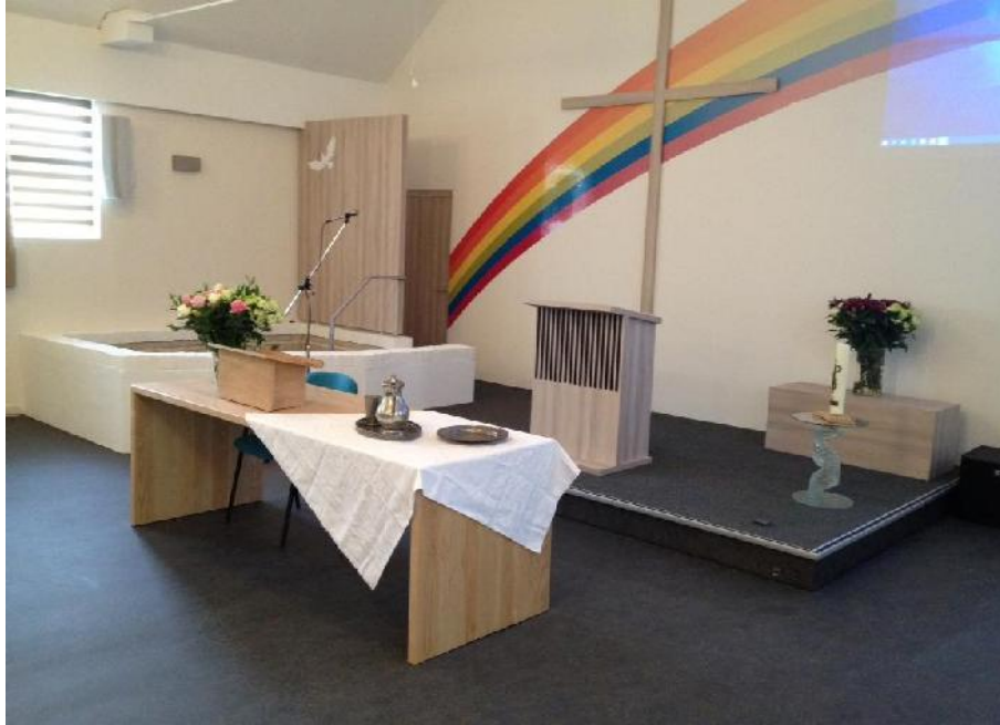
Het resultaat met de symbolen van Veelkleurigheid, het Kruis en de Duif, als opstapje naar het verhaal van Elim...