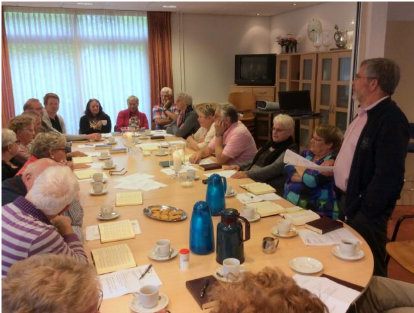
Een verrassend druk bezochte gemeentevergadering