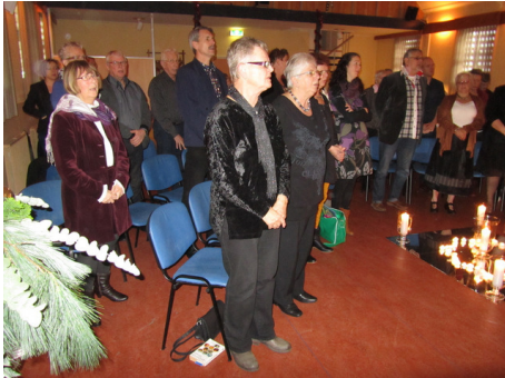
Ere zij God'