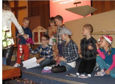
het boekje en de sinaasappel