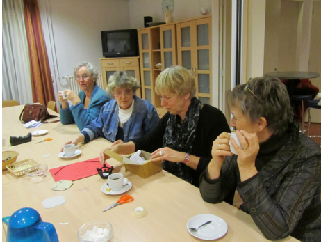
inpakken van kerstattenties