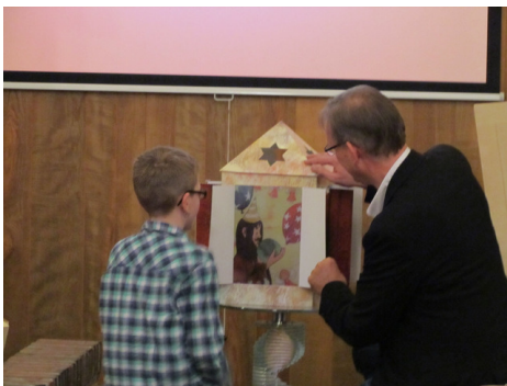
Vierde advent: deurtje van de kerstlantaarn