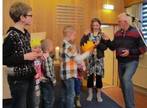
eerste advent: de kroon van de Koning