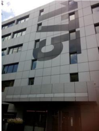
Herdenkingskerk - Baptist House

Deze zomer is de Unie verhuisd van Barneveld naar Amsterdam. Samen met het IBTSC (International Baptist Theological Study Centre) en de EBF (European Baptist Federation), voorheen in Praag, geven we daar gestalte aan het Baptist House. De beoogde definitieve locatie van het Baptist House is de plek van de Herdenkingskerk, ook aan de Postjesweg.