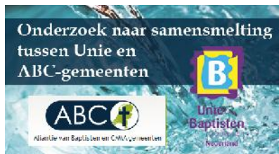
Onderzoek samensmelting Unie-ABC

Op 26 september jl. is er een ontmoeting geweest tussen een delegatie van de Unieraad en een delegatie van het bestuur van de ABC over de voortgang van het proces van onderzoek. In de zomer hebben beide besturen nagedacht over het vervolg van het onderzoek: welke investering vraagt het van beide kanten, met welk tempo voeren we het onderzoek uit? Deze vragen waren mede ingegeven door het feit dat het ABC-bestuur tegelijkertijd hard aan het werk was om het intern proces van visievorming af te ronden.