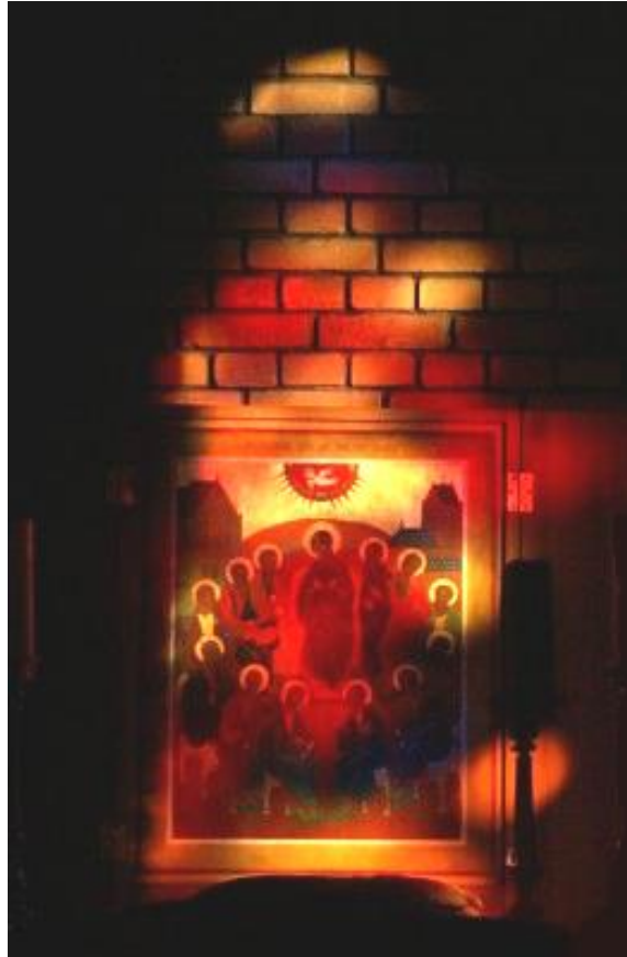
Pinkstericoon in het morgenlicht 6 uur 50 min. Ikoan troch de hân fan Jantsje Witteveen

De Apostelen op het Pinksterfeest. Vuurvlammen en hevige wind.