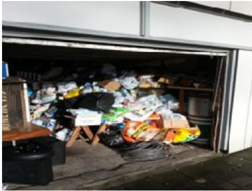
Zo zag de garage er uit toen we begonnen

Maar zover is het nog niet eerst nog maar even plakken.