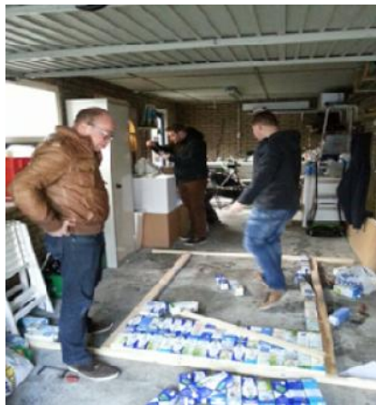
Dan het geraamte maken, en beginnen met pakken leggen.